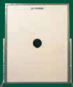
Elektronische Scheibenanlage 300 m ESA 300