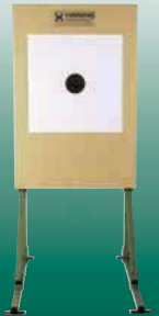
Elektronische Scheibenanlage 25/50/100 m ESA 25 ESA 50 und ESA 100