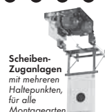
Scheibenzuganlagen mit mehreren Haltepunkten, für alle Montagearten

Postfach 1140 · D-35086 Battenberg Tel. (0 64 52) 93 32-0 · Fax: (0 64 52) 93 32-163 E-mail: info@johannsen.de Internet: www.johannsen.de