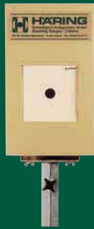
Elektronische Scheibenanlage 10 m ESA 10

Elektronische Scheiben Typ ESA für alle Distanzen! Zuganlagen für alle Sportdisziplinen! Fordern Sie kostenfrei unser Prospektmaterial an.