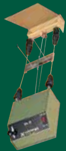
Scheibenzuganlage 10 m EL 3