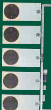
Duellanlage 25 m PA 25