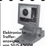
Elektronische Treffer- anzeigen von SIUS-ASCOR

Ein Begriff für perfekte Schießstand- technik